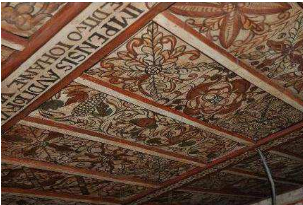
Kazetový strop evanjelického a. v. kostola v Kyjaticiach, 1637