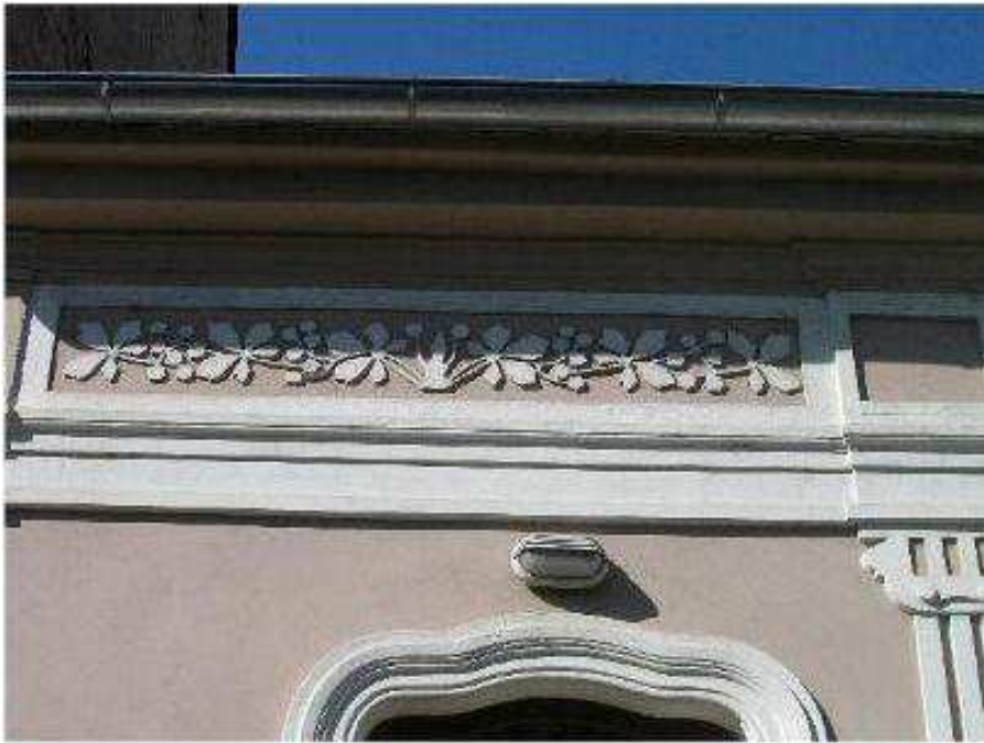
Objekt na ulici Železničná 39, secesný dekor v tvare gaštanových listov a plodov, 1900 – 1910