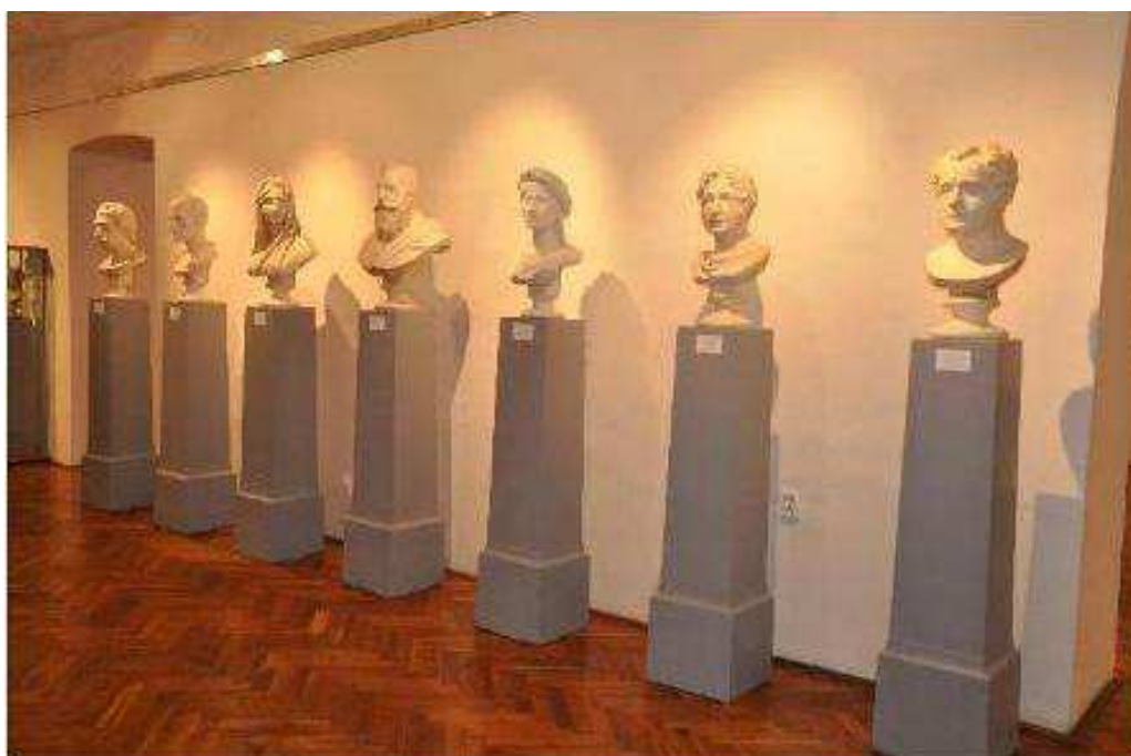
Výstava Štefan Ferenczy (1792 - 1856) Človek a dielo. 2012