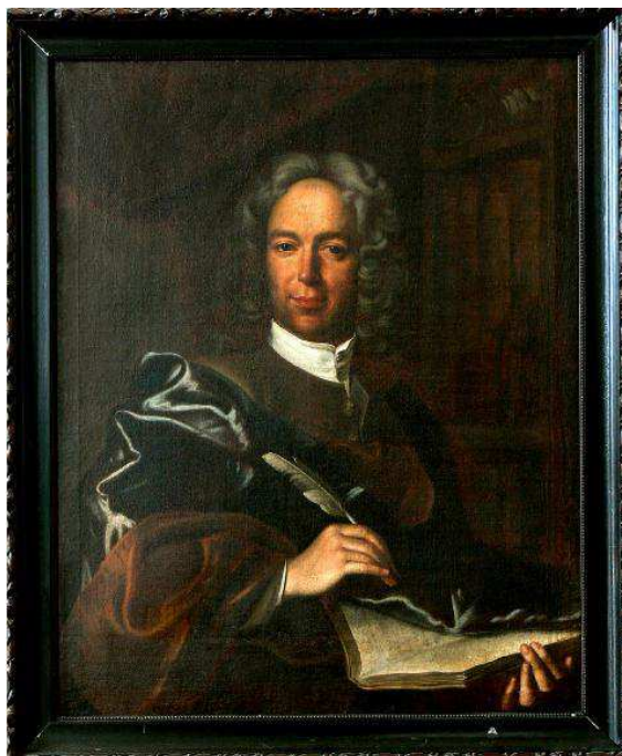
Portrét Mateja Bela (podľa Jána Kupezkého), olej na plátne, 18. - 19. storočie

Portrétny žáner je v umelecko-historickej zbierke Gemersko-malohontského múzea najpočetnejšie zastúpeným súborom diel. Nachádzame tu široký diapazón portrétnej tvorby od baroka až do polovice 20. storočia. Daná vedecko-výskumná úloha predpokladá súpis portrétovaných osobností, ktorých podobizeň sa nachádza v zbierke múzea a taktiež čiastkové výskumy za účelom zistenia proveniencie a autorstva vybraných portrétov.