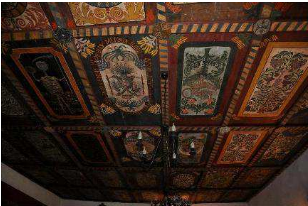
Kazetový strop artikulárneho kostola v Dúžave, polovica 18. storočia

Predmetom vedecko-výskumnej úlohy bola fotodokumentácia a výskum drevených kazetových stropov sakrálnych objektov v obciach Gemera-Malohontu. Dôraz bol kladený na analýzu a porovnávanie dekorov stropov v jednotlivých objektoch ako aj na ikonografický program a zobrazované motívy. Výsledky výskumu boli publikované v Zborníku Gemersko-malohontského múzea GEMER-MALOHONT 6-7, 2011.